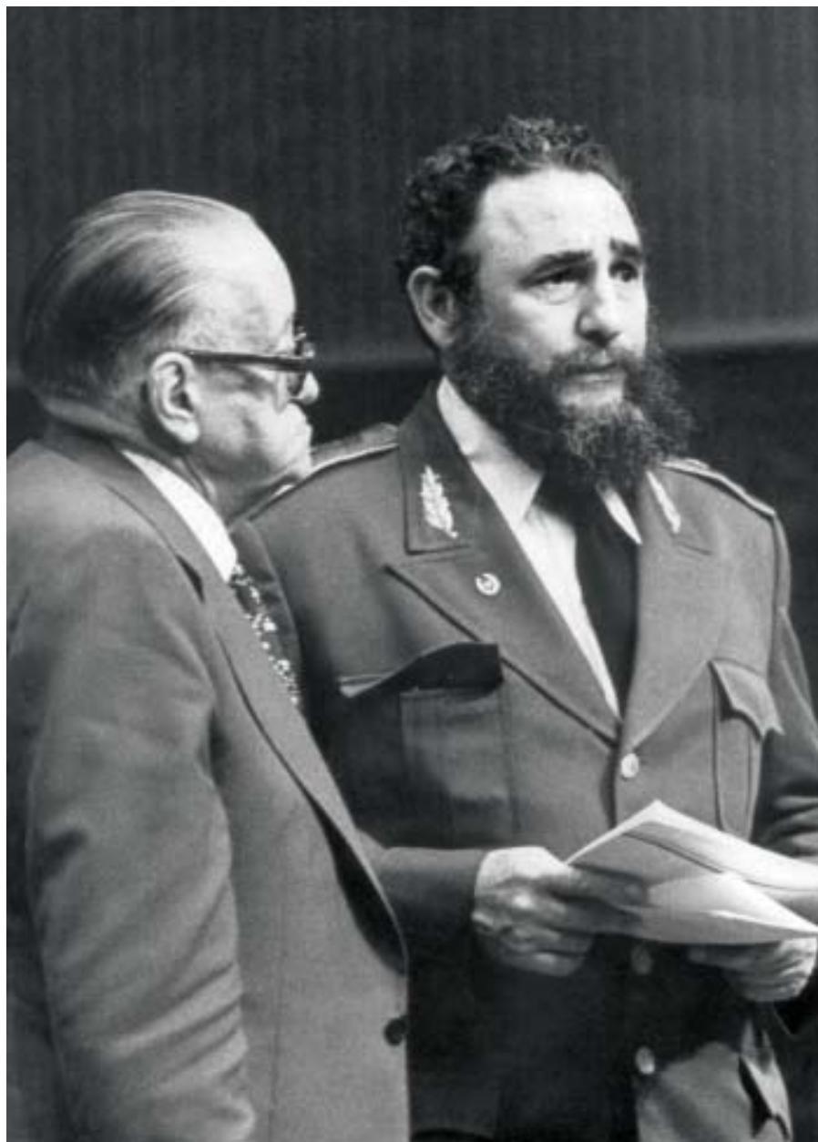
Junto al escritor Alejo Carpentier, La Habana, 1976