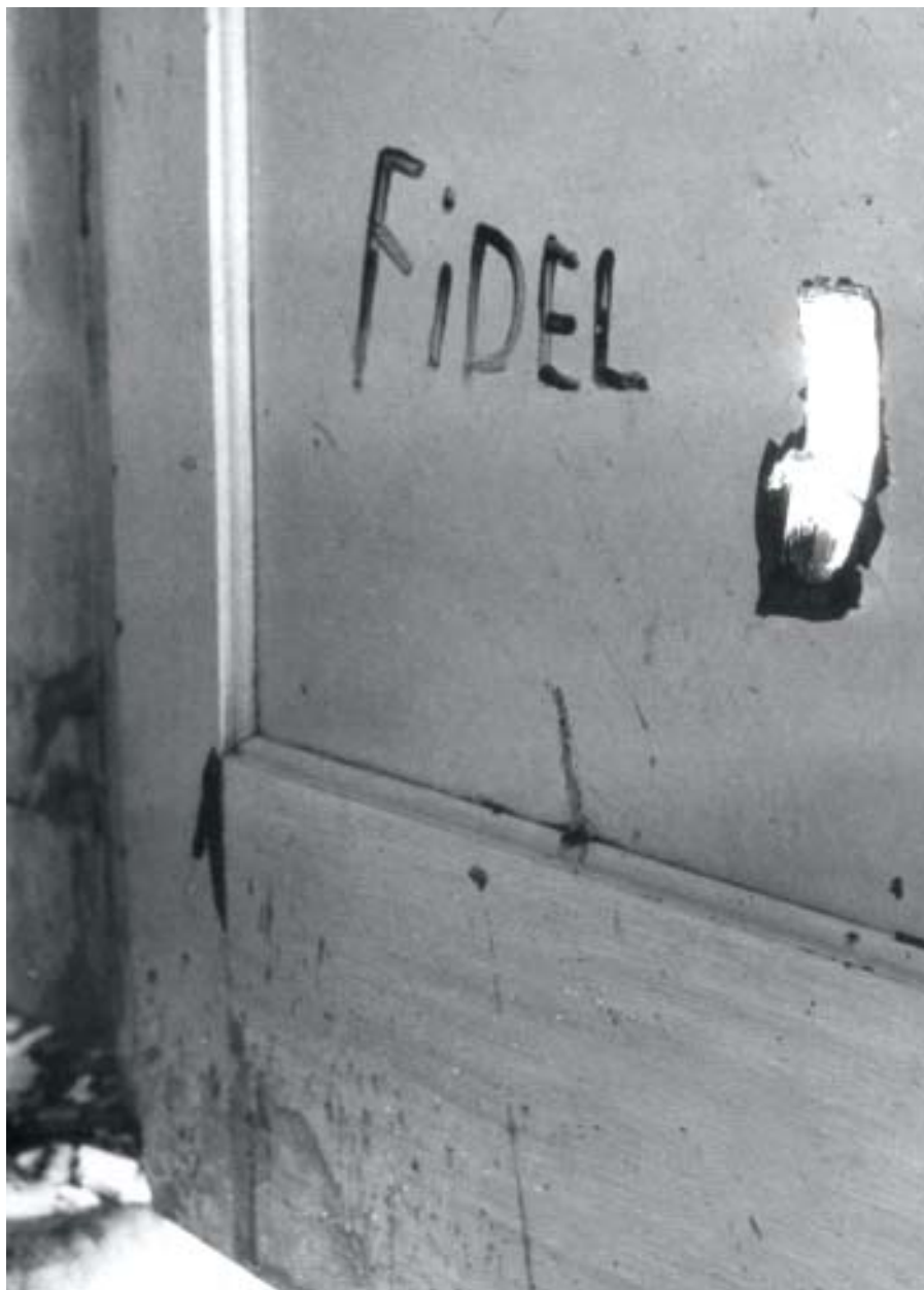
Eduardo García Delgado antes de morir, producto del ataque de aviones mercenarios, escribió con su sangre: «FIDEL», La Habana, 15 de abril de 1961