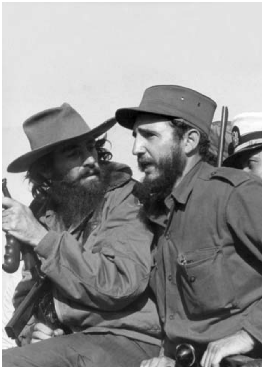
Entrada en La Habana, 8 de enero de 1959