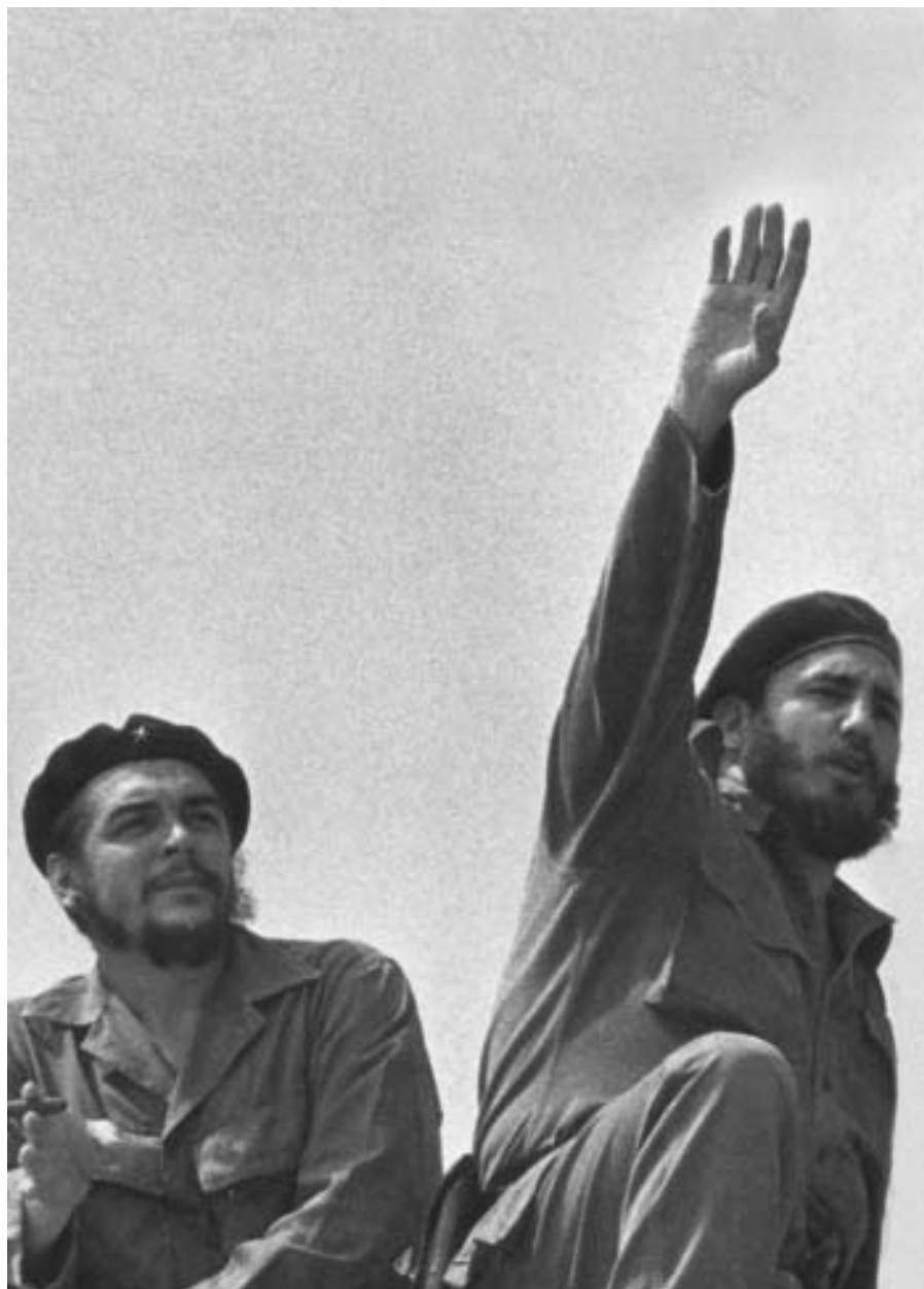
Presenciando el desfile del 1 de mayo, La Habana, 1963