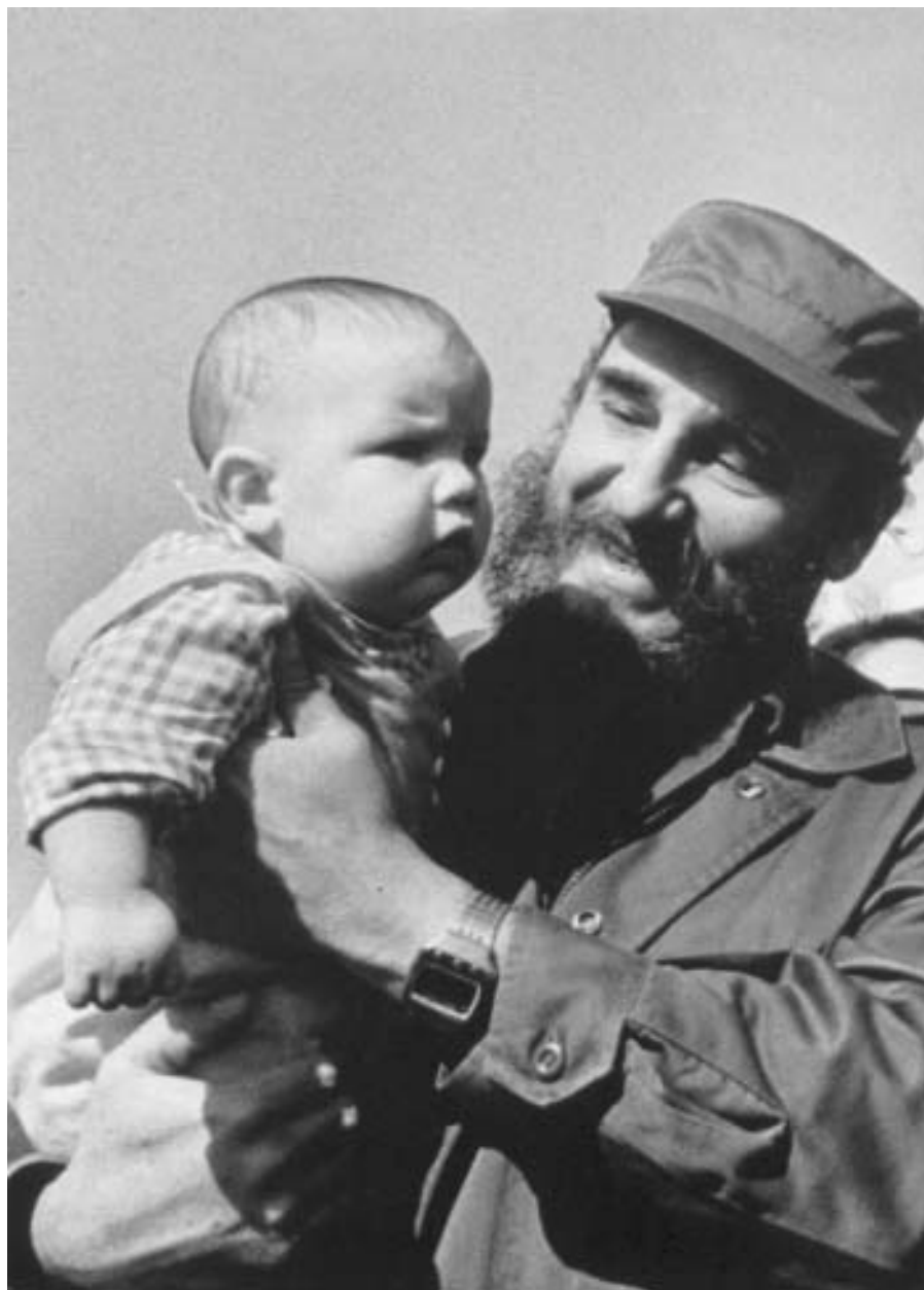
Con el hijo de Pierre Trudeau (Canadá), La Habana, 1976