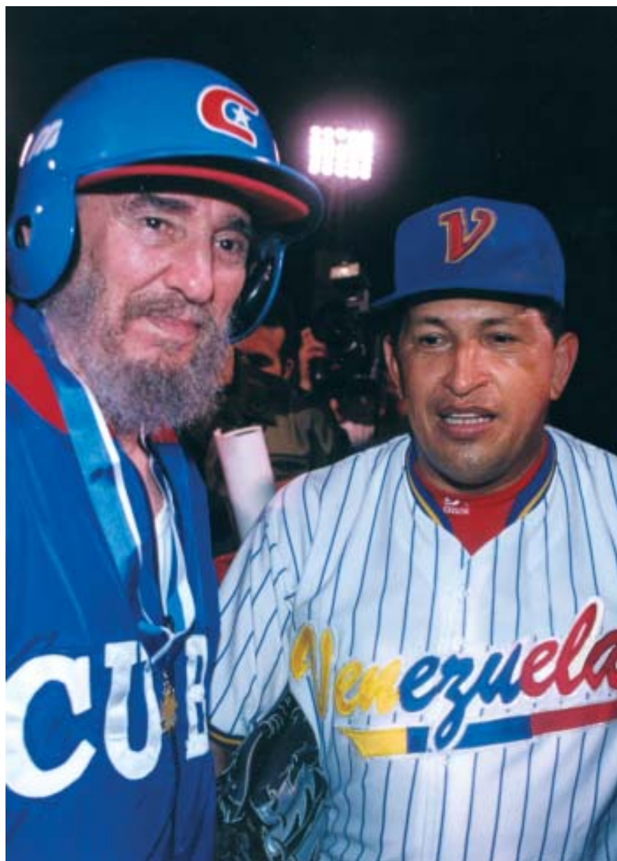
Junto a Chávez en el juego de pelota, La Habana, 2001