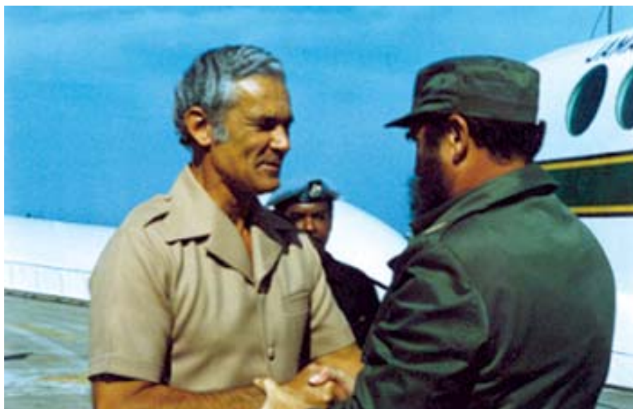
Junto a Michael Manley durante su visita a Jamaica, 1977