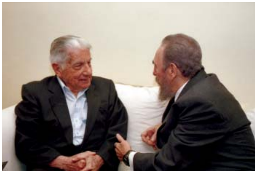
Conversando con el escritor Augusto Roa Bastos, Paraguay, 2003