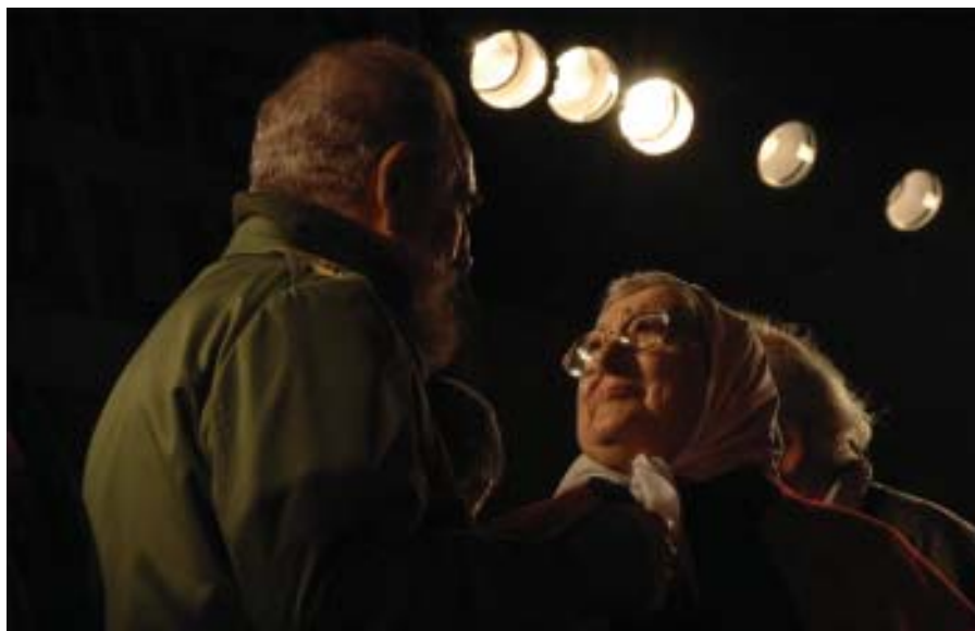
Con Hebe de Bonafine, Córdoba, 2006