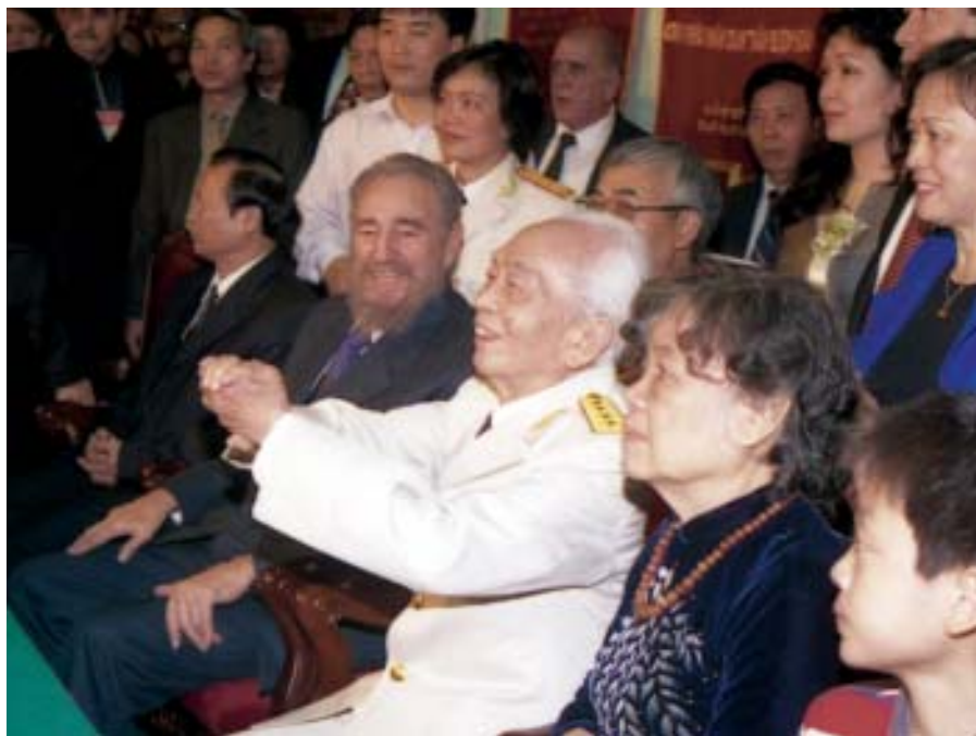
Junto al General Vo Nguyen Giap, Vietnam, 1995