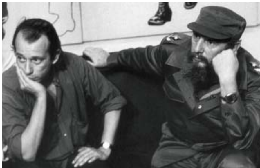
Junto a Silvio Rodríguez, en la Casa de las Américas, La Habana, 1984