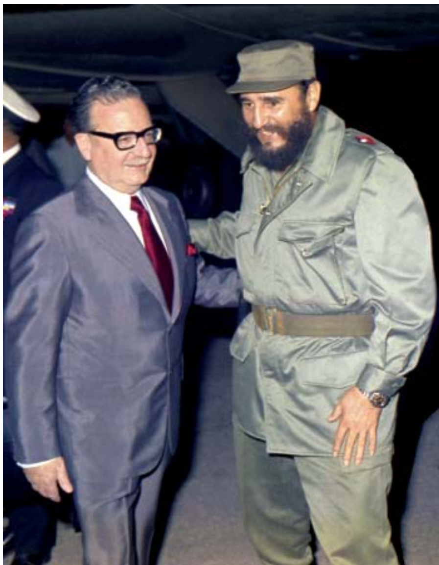
Durante la visita de Salvador Allende, La Habana, 1972