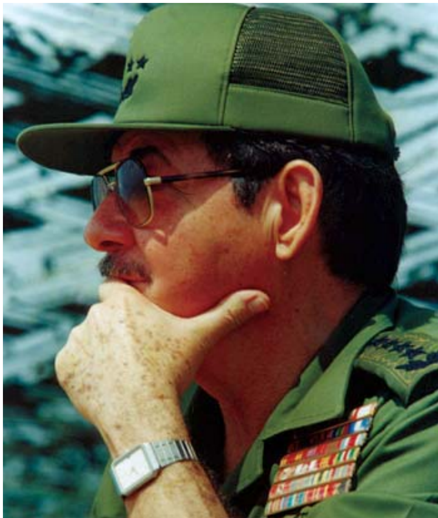
General de Ejército, Raúl Castro Ruz