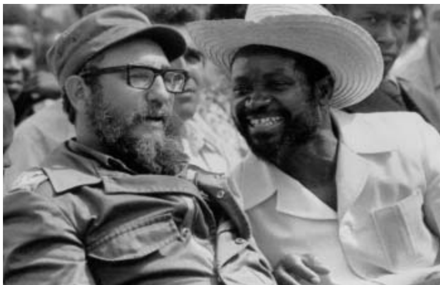
Con Samora Machel (Mozambique), Isla de la Juventud, 1977