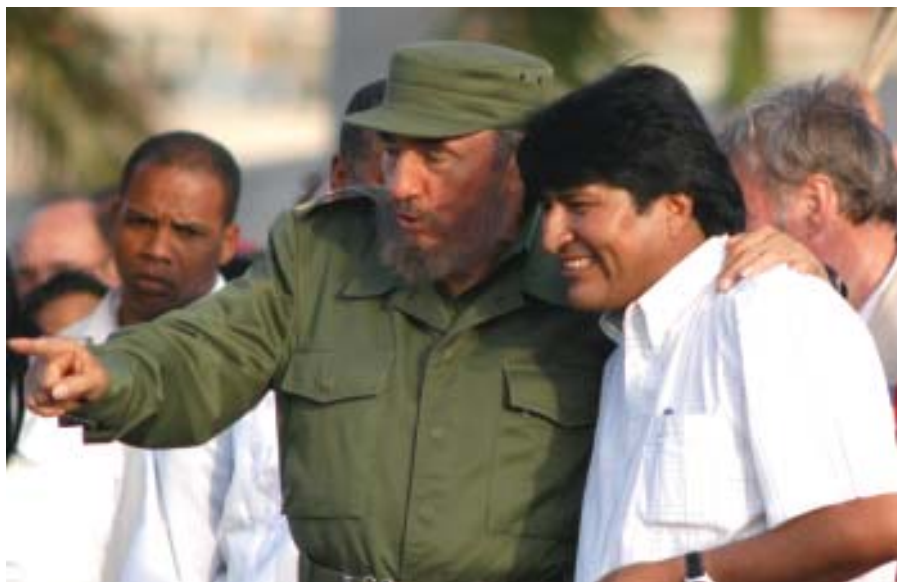
Junto a Evo Morales, La Habana, 2005