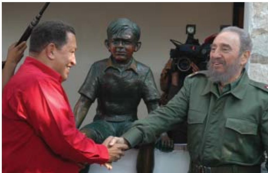
En la casa donde vivió el Ché, Córdoba, Argentina, 2006