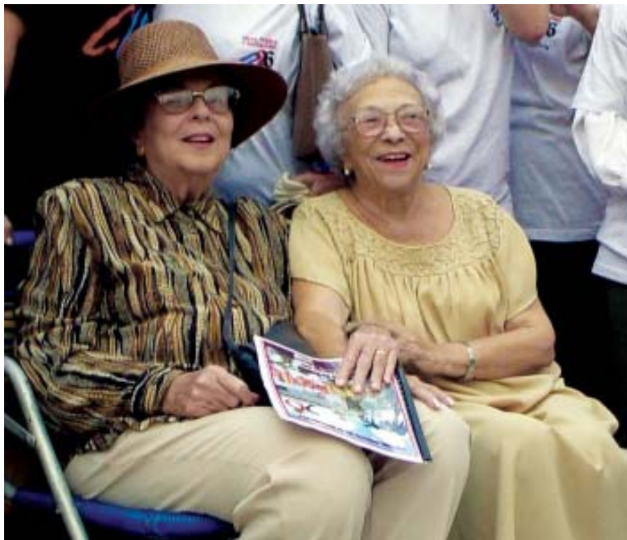
Vilma Espín y Melba Hernández en el acto por el 46 aniversario del 26 de Julio, Ciego de Ávila, 2001