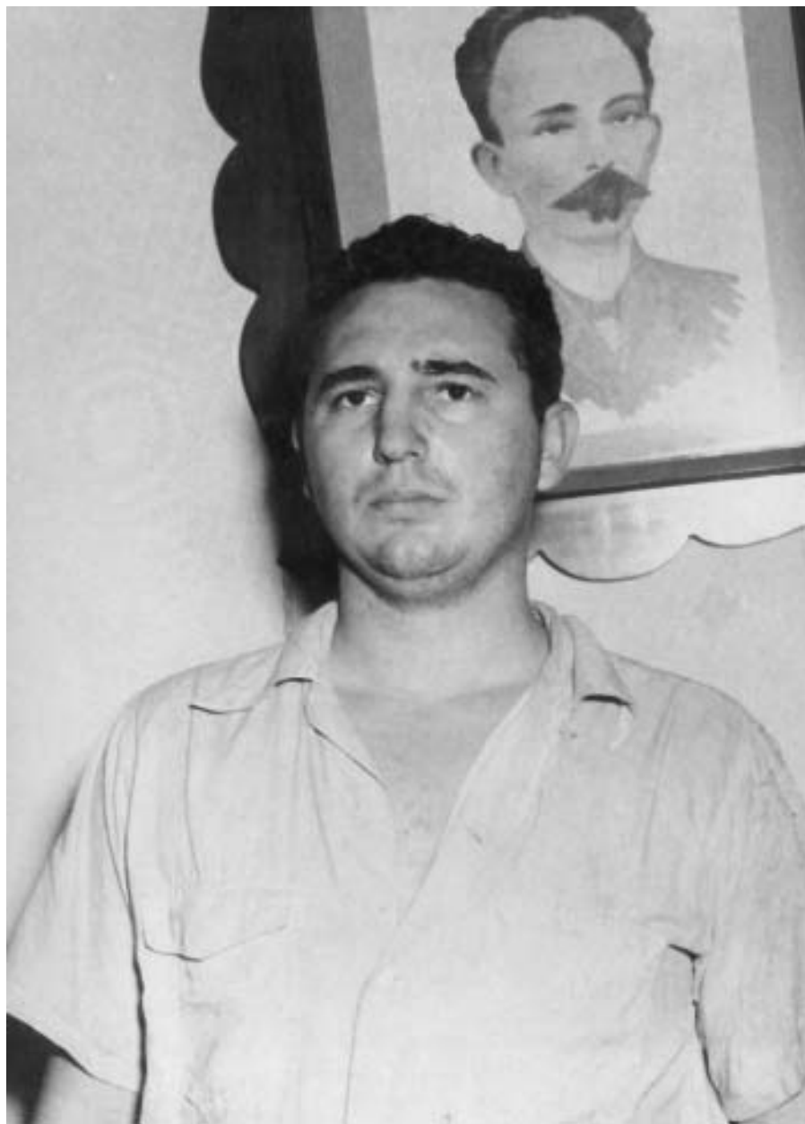
Fidel en el vivaque de Santiago de Cuba, 1953