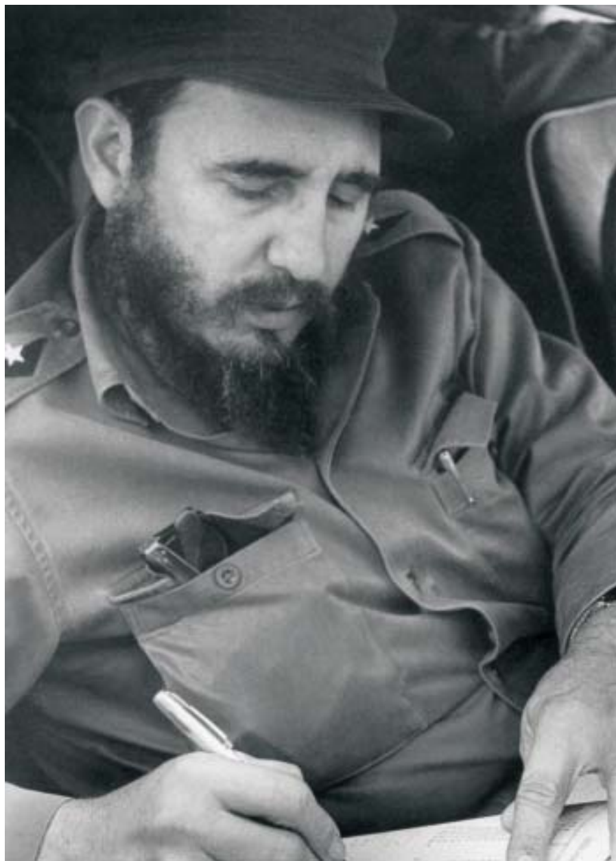
Fidel, febrero, 1970