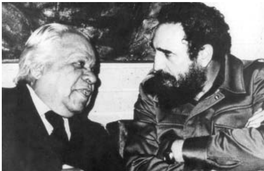
Junto al Poeta Nacional, Nicolás Guillén, 1970