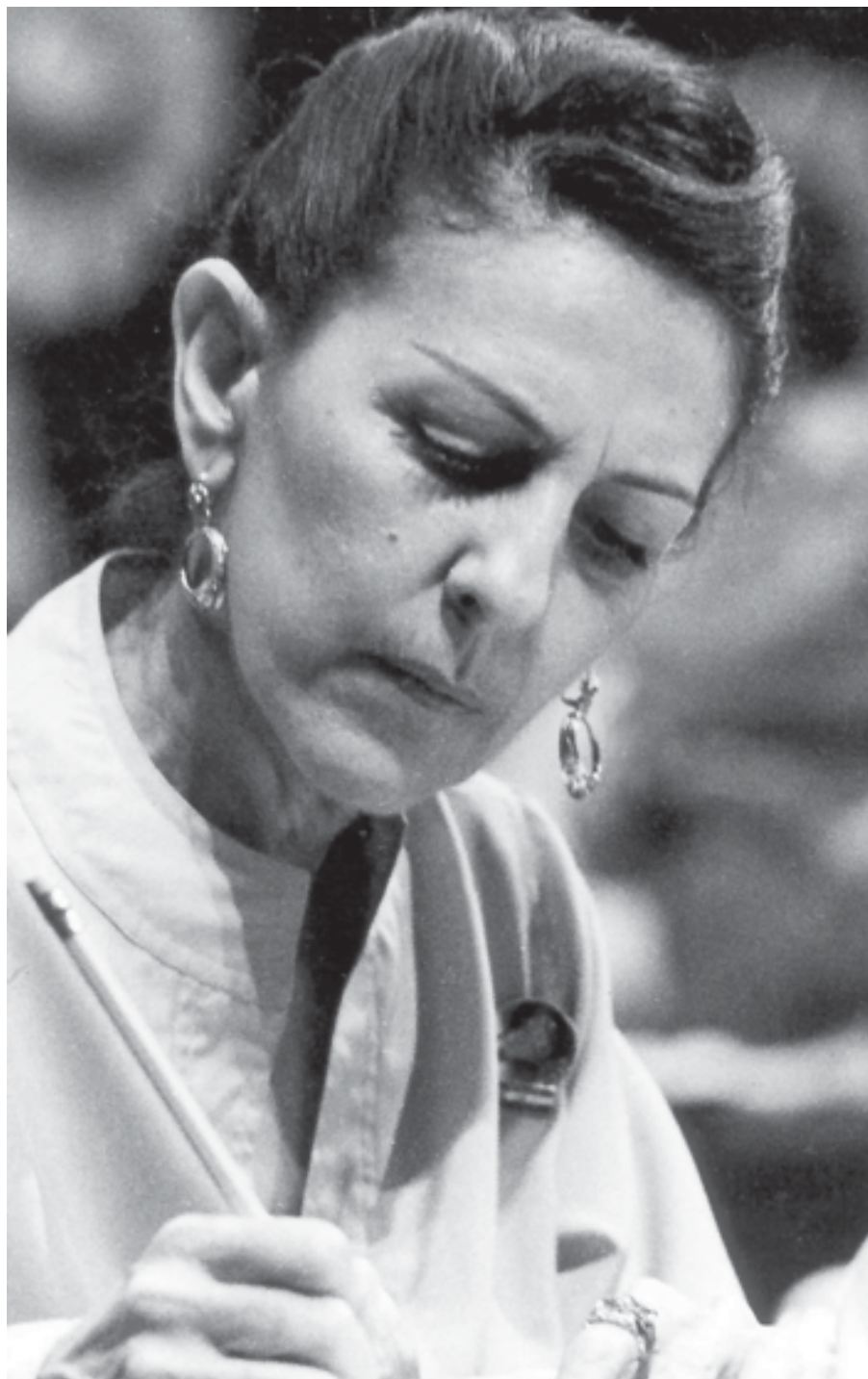
Celia Sánchez Manduley