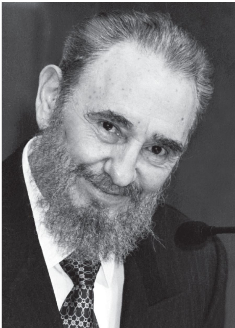
Fidel, Ginebra, 1998