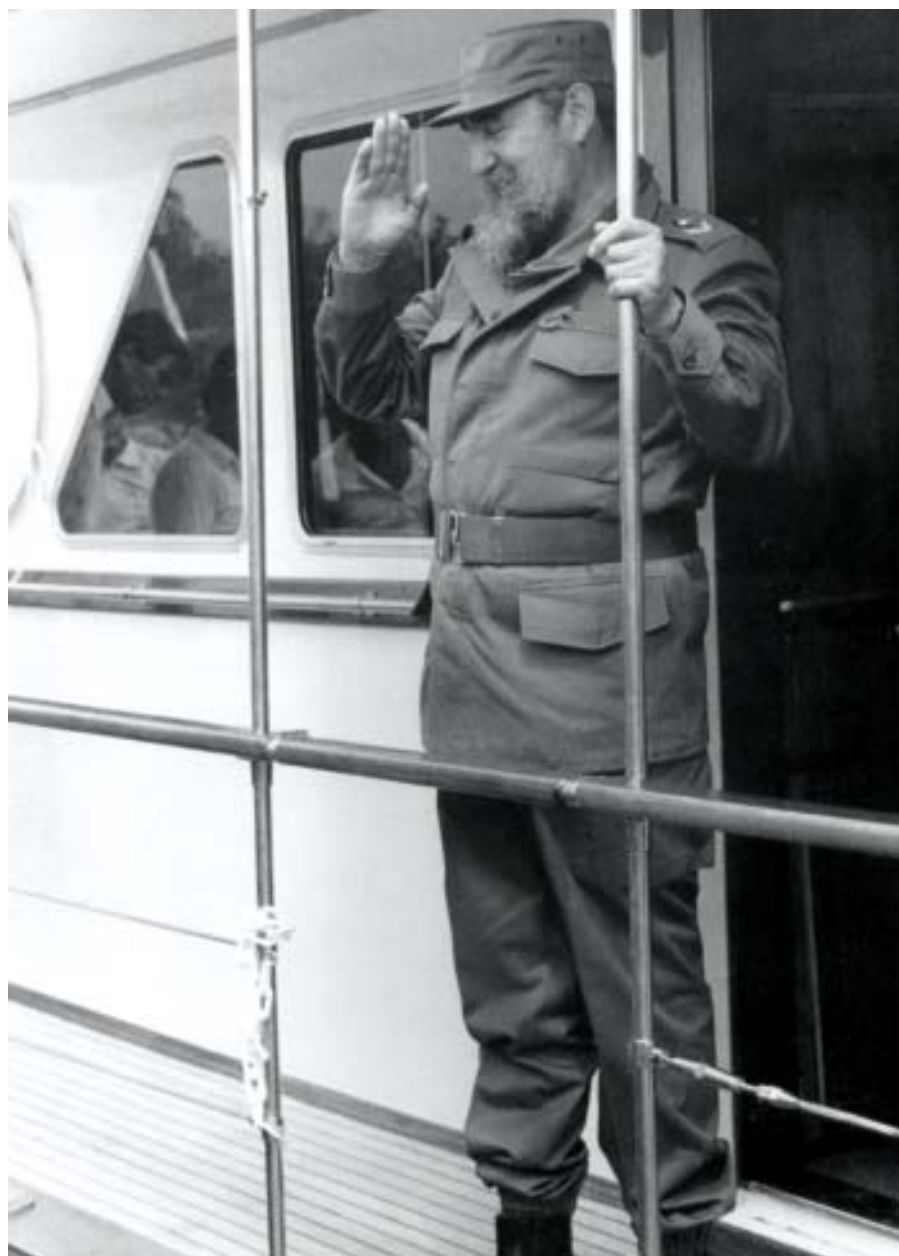
En el yate Pájaro Azul, Bahía de Cienfuegos, 1987