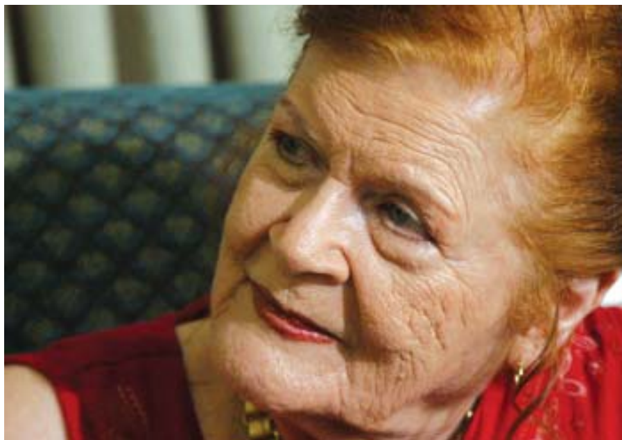
Carilda Oliver Labra