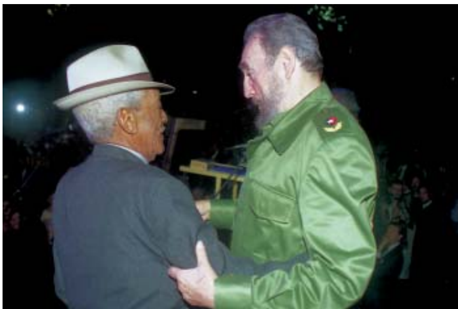
Saluda a Francisco Repilado (Compay Segundo), 2001