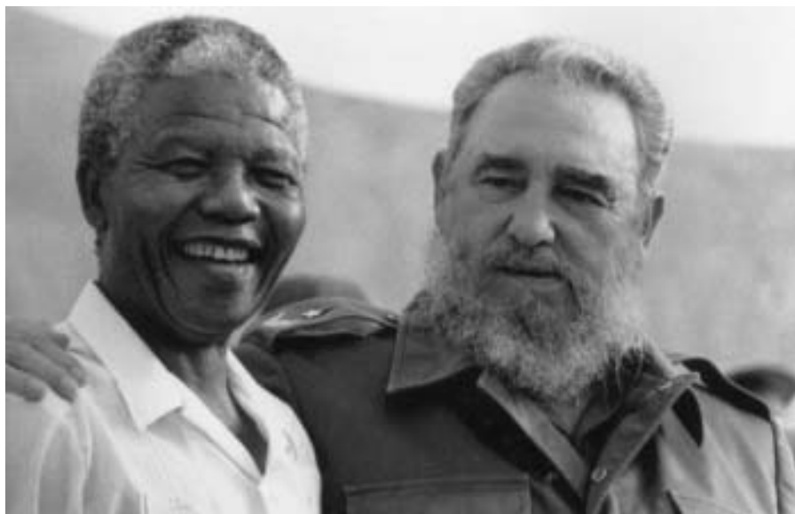
Nelson Mandela y Fidel, 1991