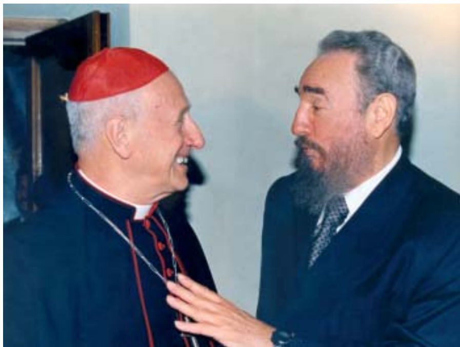
Junto al Cardenal Roger Etchegaray, Vaticano, 2000