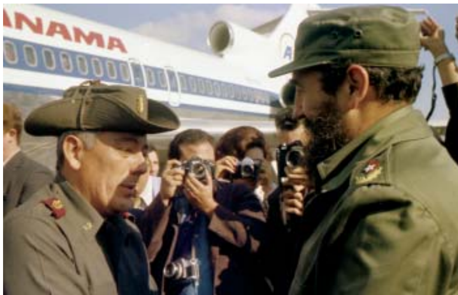
En el recibimiento a Omar Torrijos, La Habana, 1976